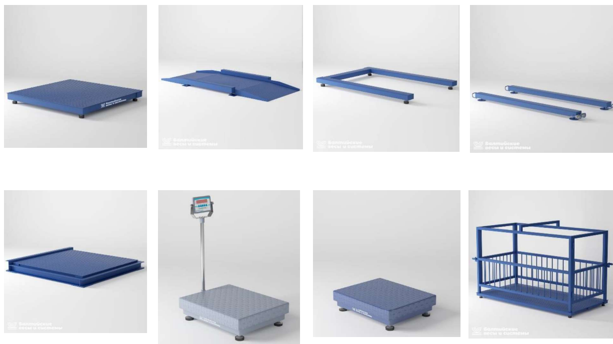
Рисунок 1 – Общий вид ГПУ весов