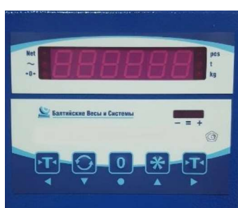
ВИП 2-1110 А