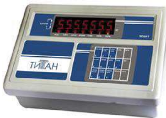
ТИТАН 9 / ТИТАН 9п