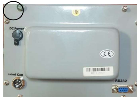
Рисунок 4 – Схема пломбировки от несанкционированного доступа