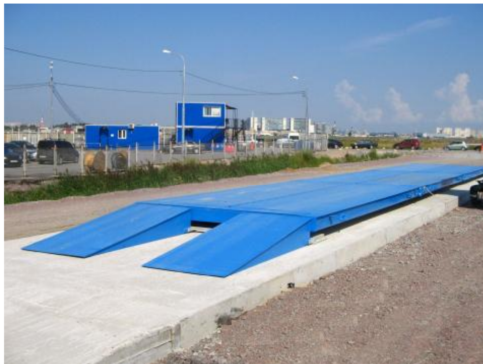
Рисунок 1 - Общий вид весов

Маркировка весов производится на разрушаемой при удалении фирменной наклейке, на которой нанесено: