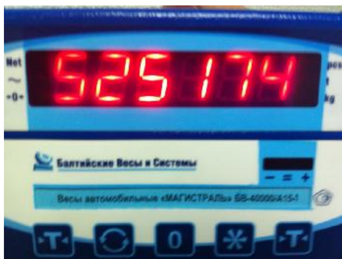
Рисунок 4 – Индикация кода юстировки

После включения весов, по окончании теста раздастся звуковой сигнал и появится сообщение «HELLO», через 3 с, после звукового сигнала на индикаторе появится шестизначный код, идентификационный номер юстировки, а затем установятся нулевые показания.