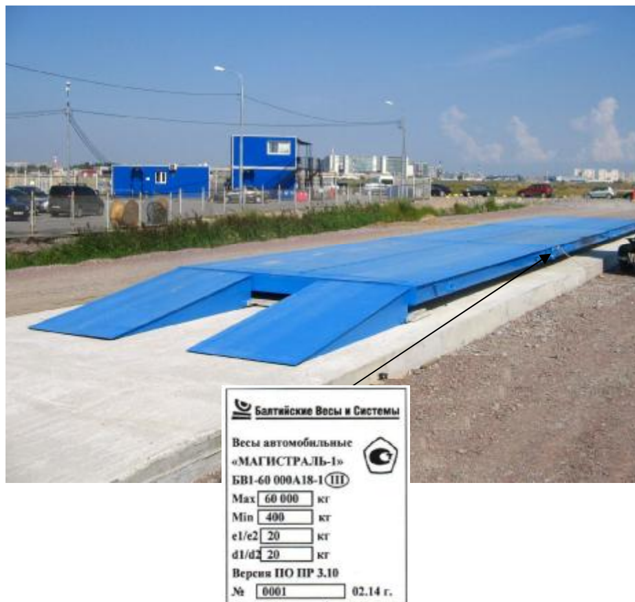
Рисунок 3 - Маркировка весов на грузоприемном устройстве

В весах предусмотрена защита компонентов и предварительно установленных регулировок (регулировки чувствительности (юстировки)) следующими средствами: